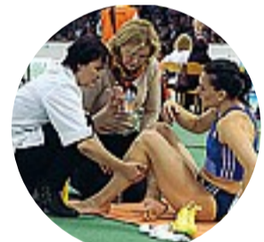
I soccorsi alla Isinbayeva

● Yelena Isinbayeva dovrà saltare tutta la stagione indoor. A 33 anni la zarina, detentrici del record del mondo dell'asta (il 5.06 saltato a Zurigo nel 2009), era stata costretta a dare forfait sabato a Volgograd, a causa di un dolore al tendine d'Achille sinistro. «Stavo riscaldandomi quando ho sentito un dolore», aveva raccontato. Gli esami hanno rivelato una grave lesione del muscolo soleare. «I medici le hanno applicato un tutore — ha dichiarato il suo allenatore, Evgeny Trofimov —. Aveva subito un infortunio simile nel 2013, ma poi era riuscita a vincere l'oro a Mosca». Dopo il Mondiale 2013, la russa si era presa una pausa e nel 2014 era diventata mamma di Eva, mentre l'anno scorso aveva annunciato il rientro verso Rio 2016. Anche lei, come tutti gli atleti del suo Paese, resta comunque in attesa di capire se la IAAF deciderà o meno di riammettere la Russia alle manifestazioni internazionali, dopo averla sospesa in seguito alla pubblicazione del rapporto sul «doping organizzato».