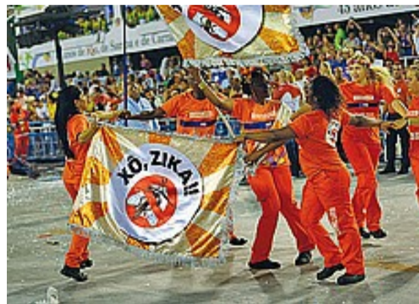
Al Carnevale di Rio si prova ad esorcizzare il pericolo Zika

● Avviso ufficioso sulla diffusione del virus Turismo, poche rinunce. Monitoraggio del Coni